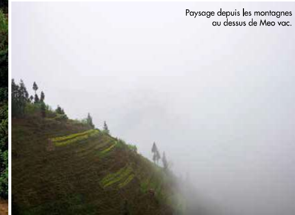
Paysage depuis les montagnes au dessus de Meo vac.

Terrain rêvé des randonneurs, les hauteurs de Meo Vac offrent des vues imprenables sur la ville, les teintes turquoise de la rivière Nho Que et les pics dentelés qui séparent le Vietnam de la Chine.