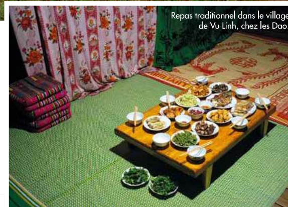
Repas traditionnel dans le village de Vu Linh, chez les Dao.

Terrain rêvé des randonneurs, les hauteurs de Meo Vac offrent des vues imprenables sur la ville, les teintes turquoise de la rivière Nho Que et les pics dentelés qui séparent le Vietnam de la Chine.