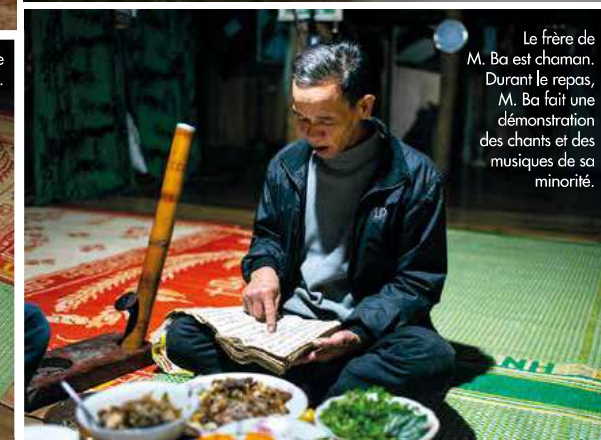
Le frère de M. Ba est chaman. Durant le repas, M. Ba fait une démonstration des chants et des musiques de sa minorité.