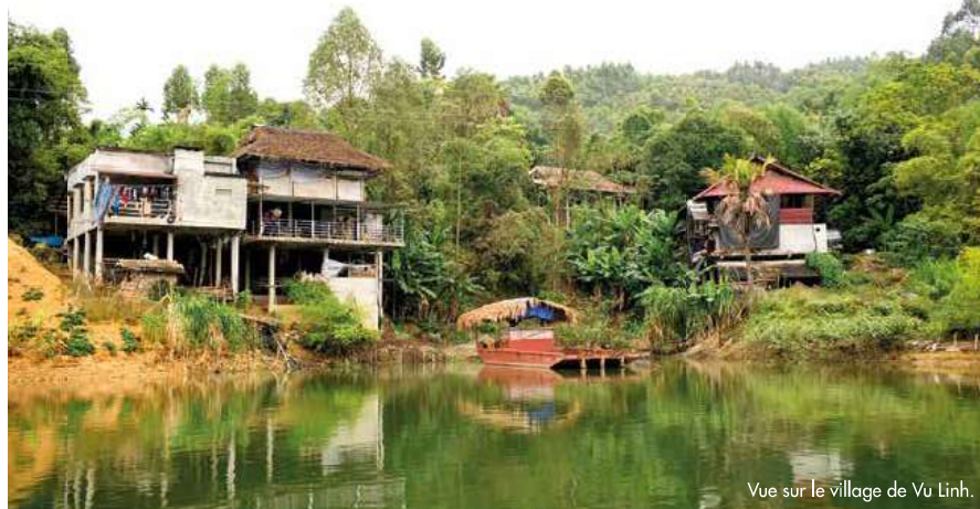
Vue sur le village de Vu Linh.