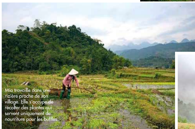
Mia travaille dans une rizière proche de son village. Elle s'occupe de récolter des plantes qui servent uniquement de nourriture pour les buffles.