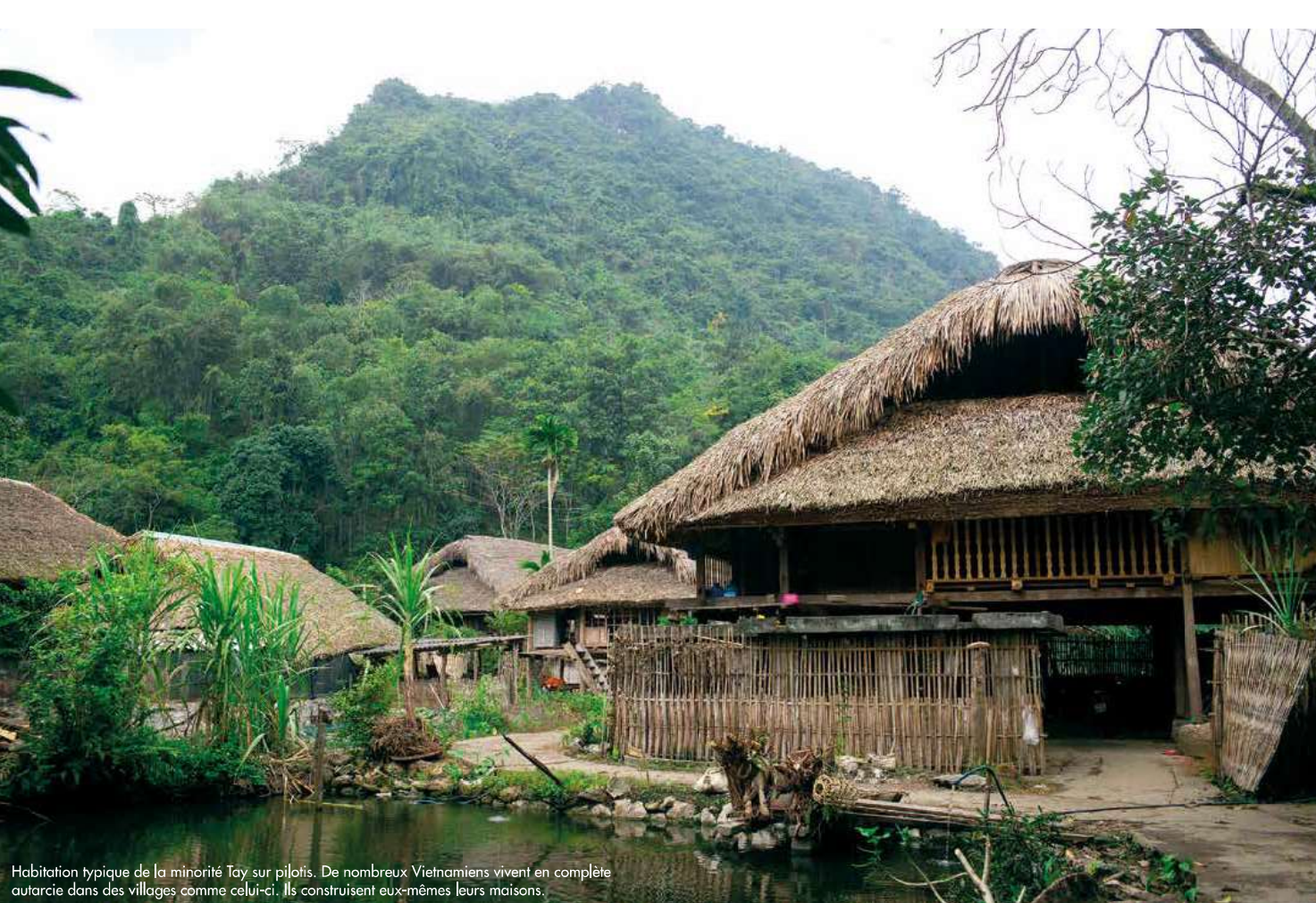
Habitation typique de la minorité Tay sur pilotis. De nombreux Vietnamiens vivent en complète autarcie dans des villages comme celui-ci. Ils construisent eux-mêmes leurs maisons.

Une balade à travers le village de Ha Thanh, non loin de Ha Giang, chef-lieu de la province du même nom, est l'occasion de se plonger dans le quotidien des Tay, la minorité ethnique qui peuple ces vallées. L'élevage et l'agriculture vivrière, très peu mécanisée, permettent aux villageois de vivre en quasi-autarcie, de la production de la nourriture à la construction de maisons traditionnelles sur pilotis, surmontées de toits en feuilles de latanier (sorte de palmier). Un cadre d'une sérénité absolue où l'on n'entend que les gloussements des poules et les grognements des cochons résonner de temps à autre. On croise aussi, sur les sentiers bordés d'étangs à l'eau verte où frétille quelques carpes, des paysans conduisant deux ou trois buffles aux champs. ●●●